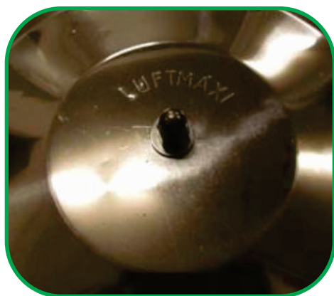
IMAGEM 4 • EXTERNA